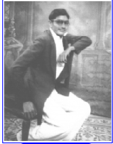
ઉમર વર્ષ - ૧૯

એક વખત મુંબઈમાં પેઢી ઉપર બેઠા છે, તેવામાં સાથે કામ કરવાવાળા એક સદ્ગૃહસ્થ આવી, હાથ જોડીને ક્ષમા માગે છે. ત્યારે આશ્ચર્ય સાથે ક્ષમા માંગવાનું કારણ પુછે છે અને ત્યારે જાણવા મળે છે કે જૈન ધર્મમાં આ પ્રકારે આખા વર્ષ દરમ્યાન જો કોઈપણ પ્રકારે એક-બીજા પ્રત્યે દોષ થયો હોય તો તેની ક્ષમા માંગવામાં આવે છે. આનંદાશ્ચર્ય સાથે જૈનદર્શન પ્રત્યે અહોભાવ જાગે છે અને આકર્ષણ થાય છે અને રાણપુરના બાળપણનો દિવસ યાદ આવે છે; ત્યાં